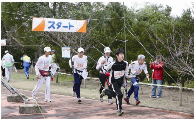
▲10月30日 左右にわかれてのスタート