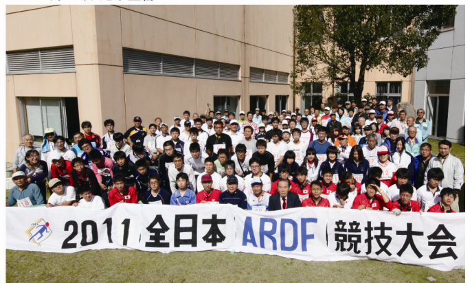
▲10月29日 エキシビジョン大会